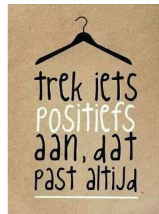
Figuur 5: trek iets positiefs aan (Oosterlaar, z.d.)

Door uit te gaan van de positieve aspecten van de leerling, de leerkracht, de groep, de school en de ouders wordt de situatie van het kind beter begrepen, kunnen doelen beter geformuleerd worden en kom je tot een beter plan. Positieve aspecten liggen in de kansen en krachten van de betrokkenen, zoals talenten, kwaliteiten, interesses en succesvolle aanpakken; maar ook in de situaties waar het probleemgedrag zich niet voordoet. Positieve aspecten bieden perspectief, dat wat goed gaat breiden we verder uit (Pameijer, Van Beukering & De Lange, 2009).