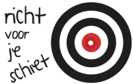
Figuur 3: afstemming (SanMax, z.d.)

Het stellen van ambitieuze doelen is een belangrijk onderdeel van handelingsgericht werken. Doelen worden gesteld, zodat duidelijk is waar de school, het team, de groep, de leerkracht, de leerling en de ouders naartoe willen. Tevens zijn doelen nodig om in kaart te brengen welke professionalisering er binnen het team nodig is. De opgestelde doelen worden uitgevoerd en geëvalueerd in een plan, zoals het plan voor de groep of het zorgplan (Pameijer, Van Beukering & De Lange, 2009).