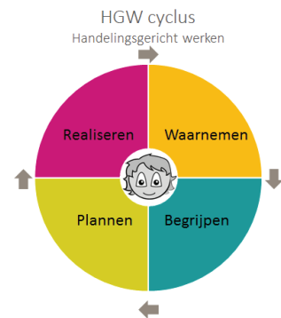
Figuur 7: HGW cyclus SLO (2015)

Iedereen die betrokken is bij een school weet hoe en waarom op school op die manier gewerkt wordt. De afspraken over wie wat doet, waarom, waar, hoe en wanneer zijn helder. De school is dan ook transparant over het werk dat zij doet, heeft gedaan en van plan is te gaan doen. Een leerkracht die handelingsgericht werkt, werkt planmatig. De HGW-cyclus biedt hierbij houvast: waarnemen, plannen, realiseren, evalueren en bijstellen. Hierbij heeft de leerkracht een onderzoekende en reflectieve houding (Pameijer, Van Beukering & De Lange, 2009).