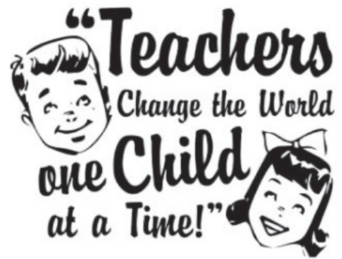
Figuur 1: leerkrachten veranderen de wereld (teacher quotes, z.d.)

Door het geven van zo goed mogelijk adaptief onderwijs levert de leerkracht een bijdrage aan een positieve ontwikkeling van leerlingen. Dit geldt zowel voor de leer- en werkhouding als voor het sociaal-emotioneel functioneren. Uit onderzoek blijkt dat de leerkracht binnen de school de grootste invloed heeft op de prestaties van leerlingen. De leerkracht kan afstemmen op verschillen tussen leerlingen en zo het onderwijs passend maken. Een sterke leerkracht is effectief voor alle leerlingen, ongeacht hun kenmerken. De schoolprestaties van de leerlingen gaan bij deze leerkracht meer vooruit (Pameijer, Van Beukering & De Lange, 2009).