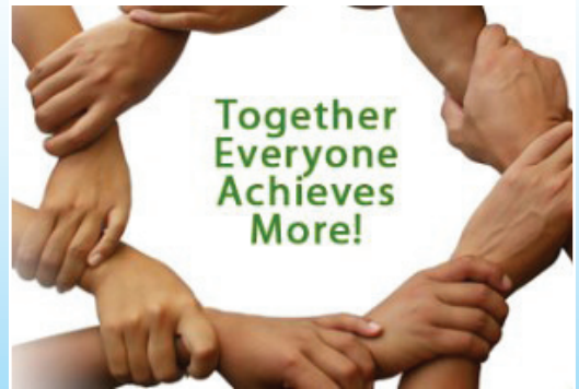
Figuur 6: samen bereiken we meer (Ilab14, 2015)