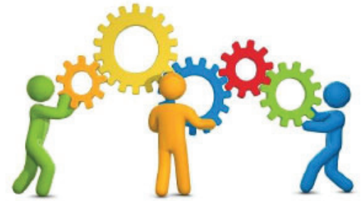
Figuur 4: afstemming en wisselwerking

HGW kijkt naar stimulerende en belemmerende factoren die door de school beïnvloed kunnen worden. De wisselwerking tussen actie en reactie van de leerkracht, de leerling, de groep en de ouders wordt geanalyseerd. De meest effectieve leerkrachten passen een verschillende aanpak toe bij leerlingen. Dit vergt doelgericht omgaan met verschillen (Pameijer, Van Beukering & De Lange, 2009).